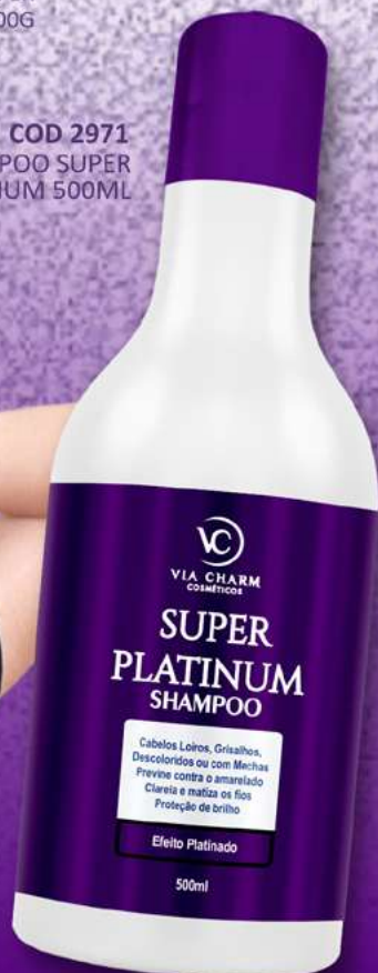
COD 2971 SHAMPOO SUPER PLATINUM 500ML