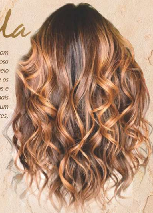
COD 2990 SHAMPOO COR IDEAL MORENA ILUMINADA 500ML

Desenvolvido com pigmentos de alta qualidade, com vitamina E, óleo de Argan, óleo de Ojon e a famosa queratina, onde restaura os fios danificados pelo processo de descoloração da Morena Iluminada e os nossos óleos que hidratam profundamente os fios e dão brilho, revitalizando e deixando com muito mais brilho e cor luminosa. Com Vitamina E que é um antioxidante que neutraliza os radicais livres, protegendo o couro cabeludo e os fios.